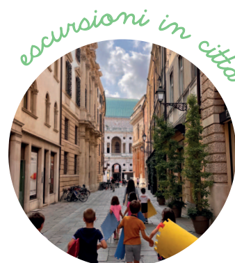
escursioni in città

Un'occasione unica per scoprire — taccuino alla mano — le bellezze del nostro centro storico. Con i loro disegni, i bambini realizzeranno una nuova guida illustrata della città.