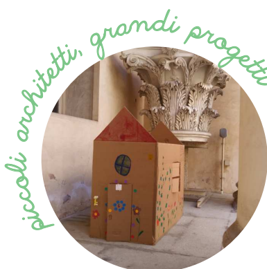
piccoli architetti, grandi progetti

Superiamo i confini del foglio bianco per immaginare " in grande "! Anche i più piccoli sanno dare vita a grandi e importanti progetti.