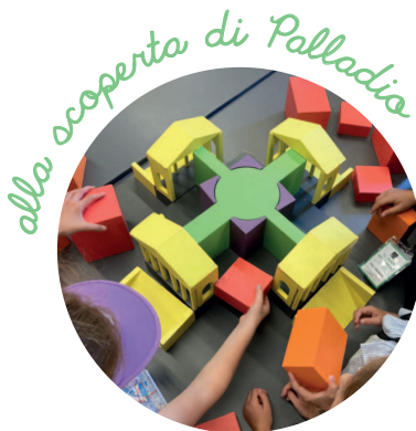
alla scoperta di Palladio

All'inizio di ogni settimana i bambini esploreranno il Palladio Museum, alla scoperta dell'architettura di Andrea Palladio .