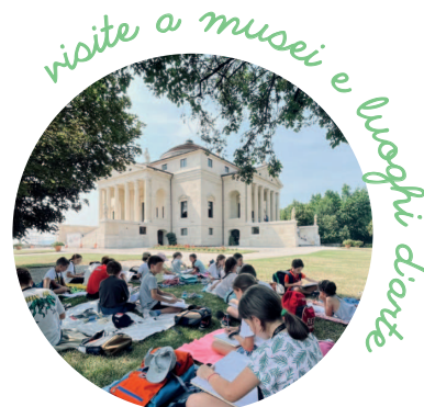
visite a musei e luoghi d'arte

Dentro al Palladio Museum batte un cuore verde, il meraviglioso gelso che cresce in cortile. L'ombra generosa di questo albero simbolo del museo sarà la nostra stanza dei giochi.